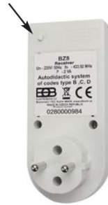
Abb. 1: Funktionstaste

Bemerkung: Es ist möglich bis zu 8 Codes einzulernen, ein weiterer höherer Code überschreibt automatisch den ersten Code!